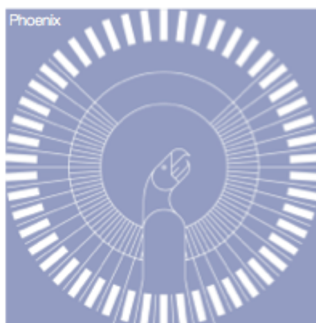
Decade 2 2010-2020