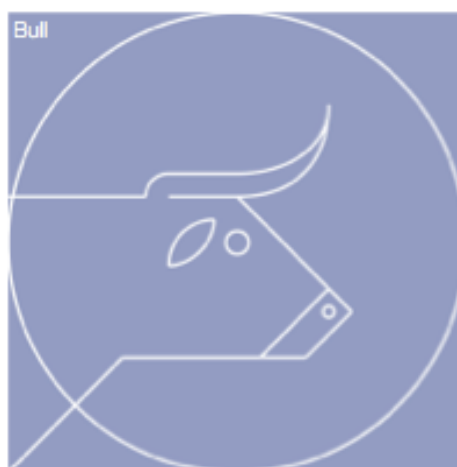
Decade 1 2000-2010